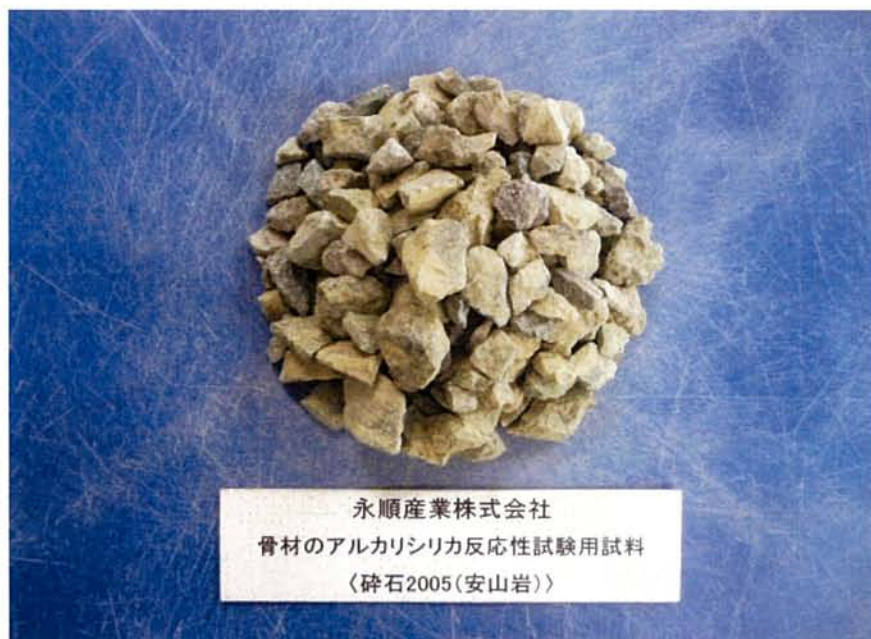
試験用試料の搬入写真