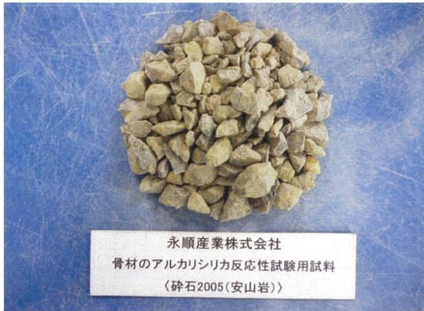
試験用試料の搬入写真